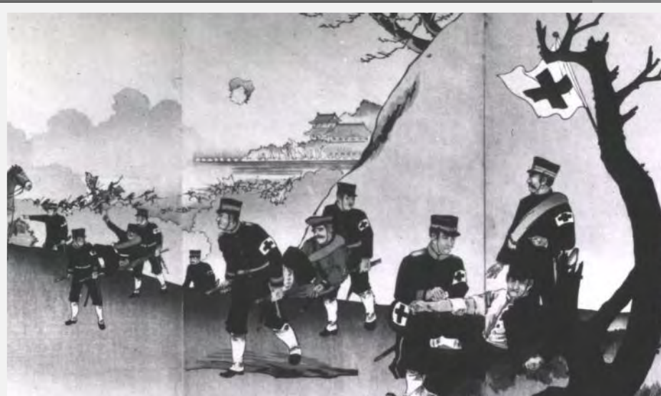
A Japanese water-colour showing the Russo-Japanese War in 1904-1905